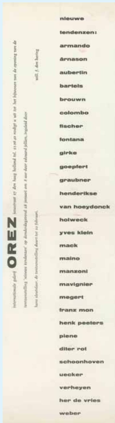
Einladungskarte Ausstellung „Nieuwe Tendenzen“, Galerie Orez, Den Haag 1962