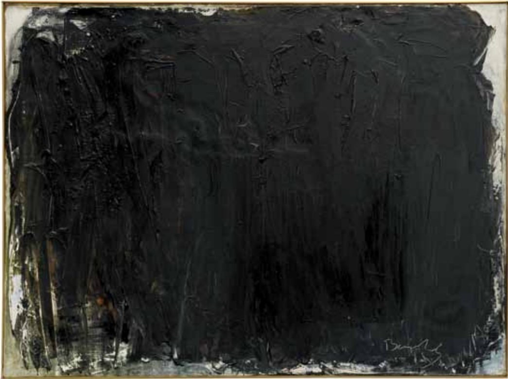
No. 151, Blackboard , 1959, Öl auf Leinwand, 90,2 x 120,2 cm