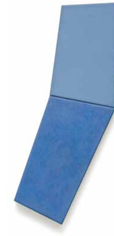
No. 466, 1982, Combine 2-teilig, Öl- und Harzfarbe auf Nessel, 58 x 17 cm