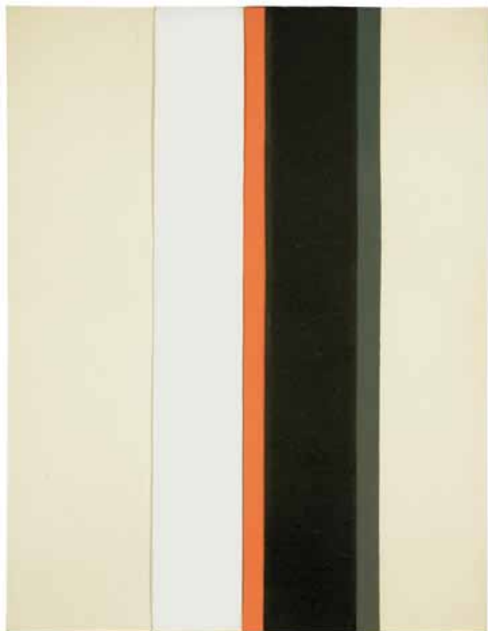
Streifenblatt , 1967, Collage auf Pappe, 65 x 50 cm