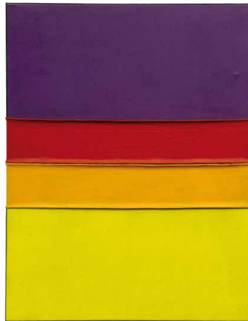
No. 344 , 1965, waagrechte Streifenüberspannung, Acryl, Öl, Harzfarbe auf Leinwand, auf Spanplatte aufgezogen, 89,5 x 70 cm