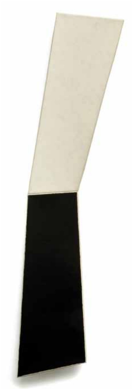
No. 446, 1981, Combine 2-teilig, Öl- und Harzfarbe auf Nessel, 143 x 28 cm