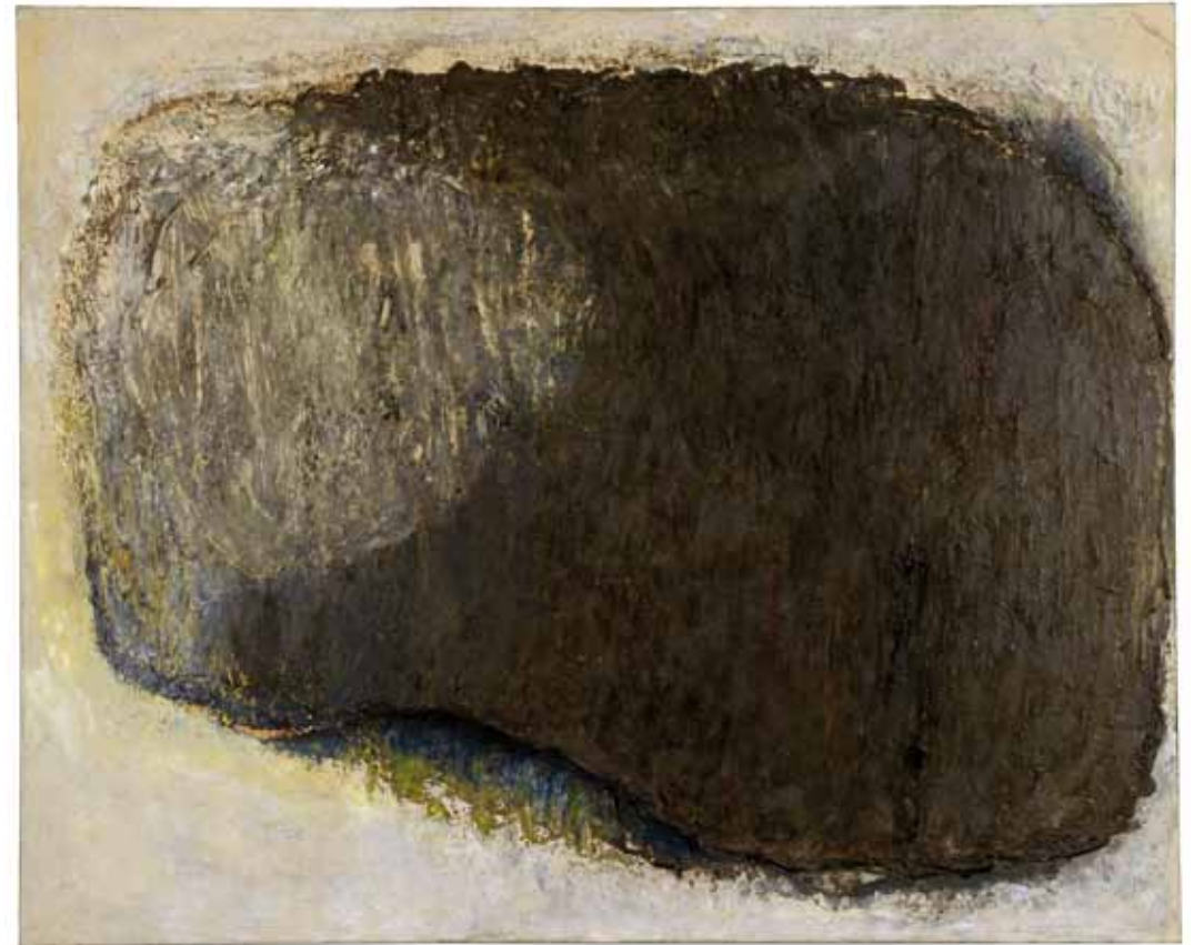
No. 179, Cohn , 1959, Harz und Öl auf Leinwand, 130 x 160 cm