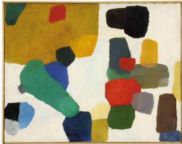
W.S. 17, 1955, Fleckenbild, Öl auf Leinwand, 57 x 95,3 cm