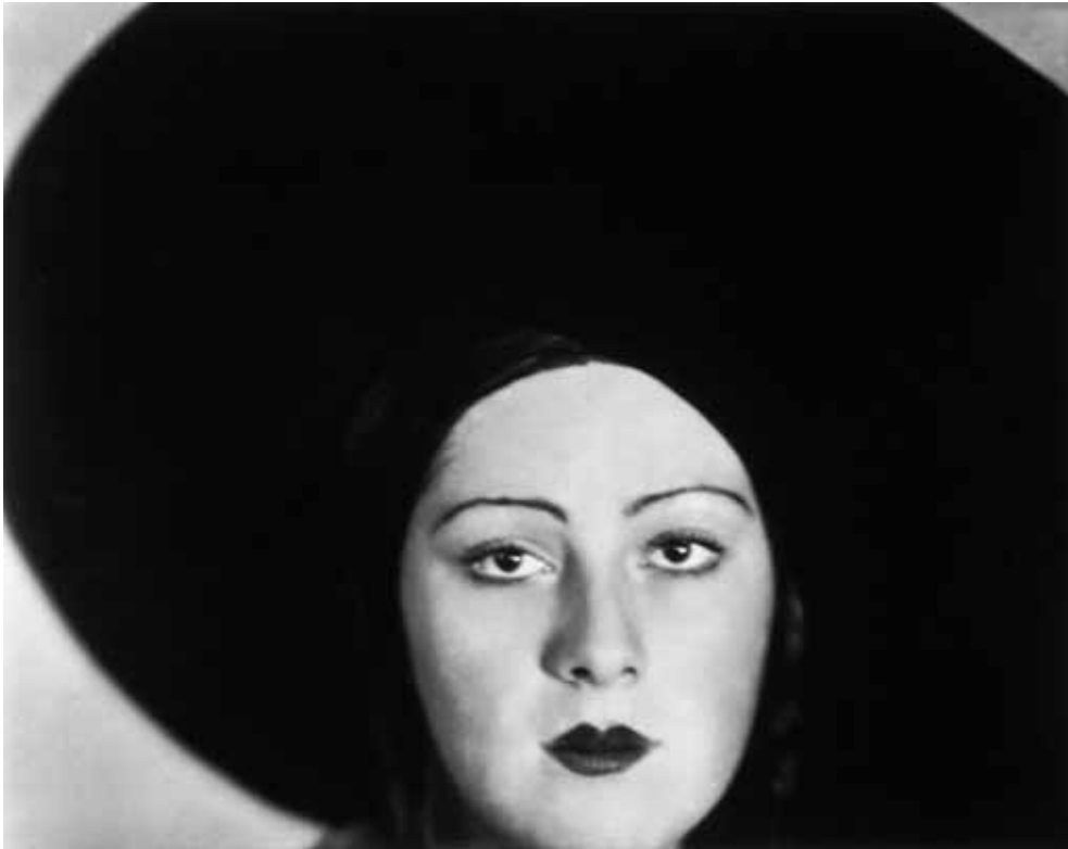
Kopf einer Tänzerin (Niura Norskaya), Berlin 1929