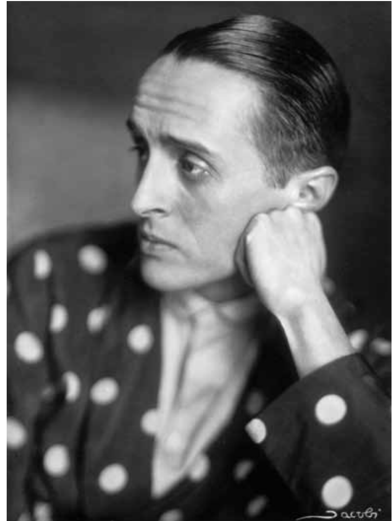
René Clair, Berlin um 1930