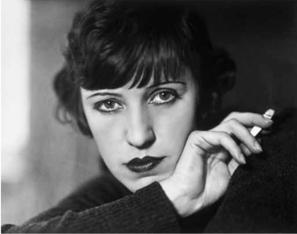
Lotte Lenya, Berlin 1929