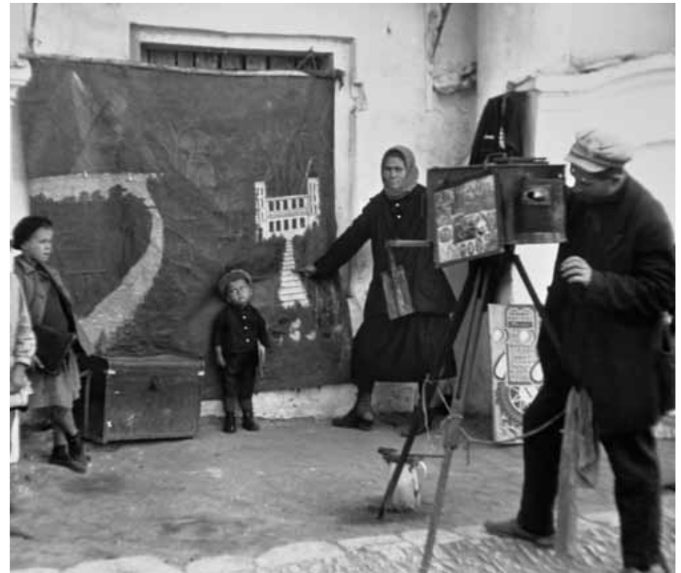
Straßenphotograph, Moskau 1932

Nur wenige Wochen später brach die Photographin zu einer ausgedehnten Reise durch Usbekistan und Tadschikistan auf, wohin vor ihr kaum ausländische Photographen gekommen waren. Mit dem Schnellzug vom Kasaner Bahnhof dauerten die knapp 3 500 Kilometer durch die kasachische Steppe vier Tage und vier Nächte bis Taschkent, der Hauptstadt von Usbekistan. Von dort aus ging es noch einmal zwei Tage weiter durch die alten Stadtoasen Samarkand und Buchara in das gebirgige Tadschikistan bis nach Stalinabad. Kisch hatte die Verbindung zum Vizepräsidenten der tadschikischen SSR, Abdurachim Chodschibajew, hergestellt, der Lotte Jacobi nach Stalinabad (Duschanbe) zu einem offiziellen Photoauftrag einlud. Mit ihren Aufnahmen wollte er endlich der Welt ein Bild vom neuesten Entwicklungsstand der beiden Sowjetrepubliken geben und die Ansichten über Buchara und Samarkand als Städte aus »Tausend