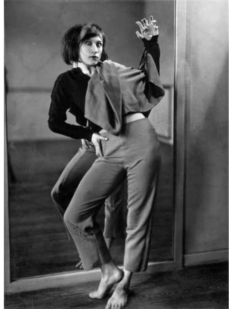
Die Tänzerin Vera Skoronel, Berlin 1930