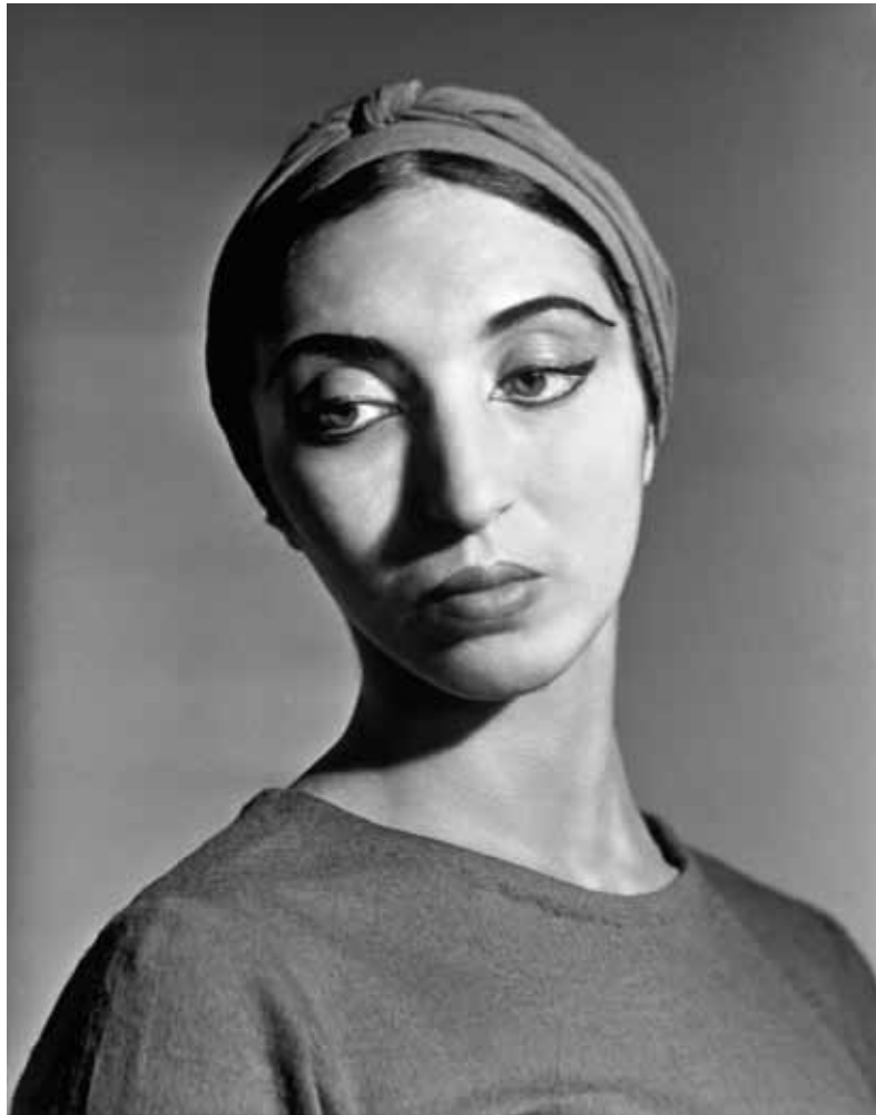
Die Tänzerin Pauline Koner, New York um 1940