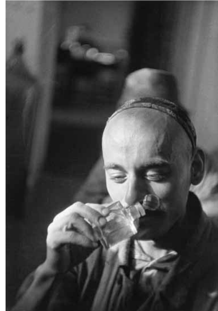
In der Fabrik für Ätheröle und Chemie, in der auch Parfüm hergestellt wird, Chodschent, Tadschikische SSR 1932