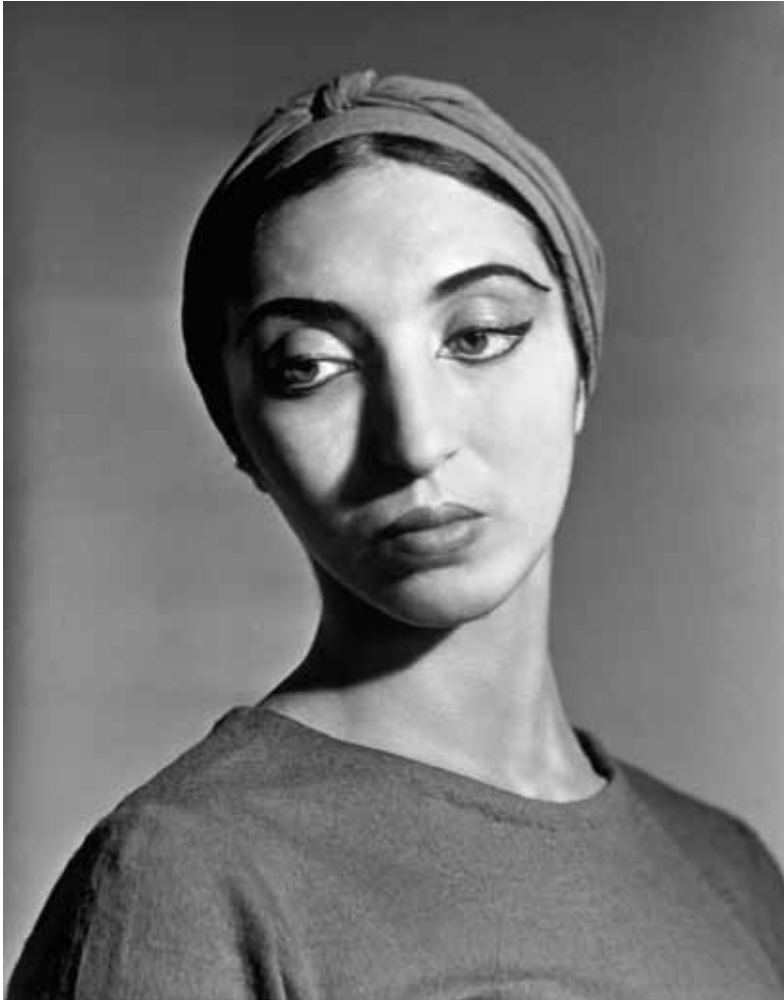
Die Tänzerin Pauline Koner, New York um 1940