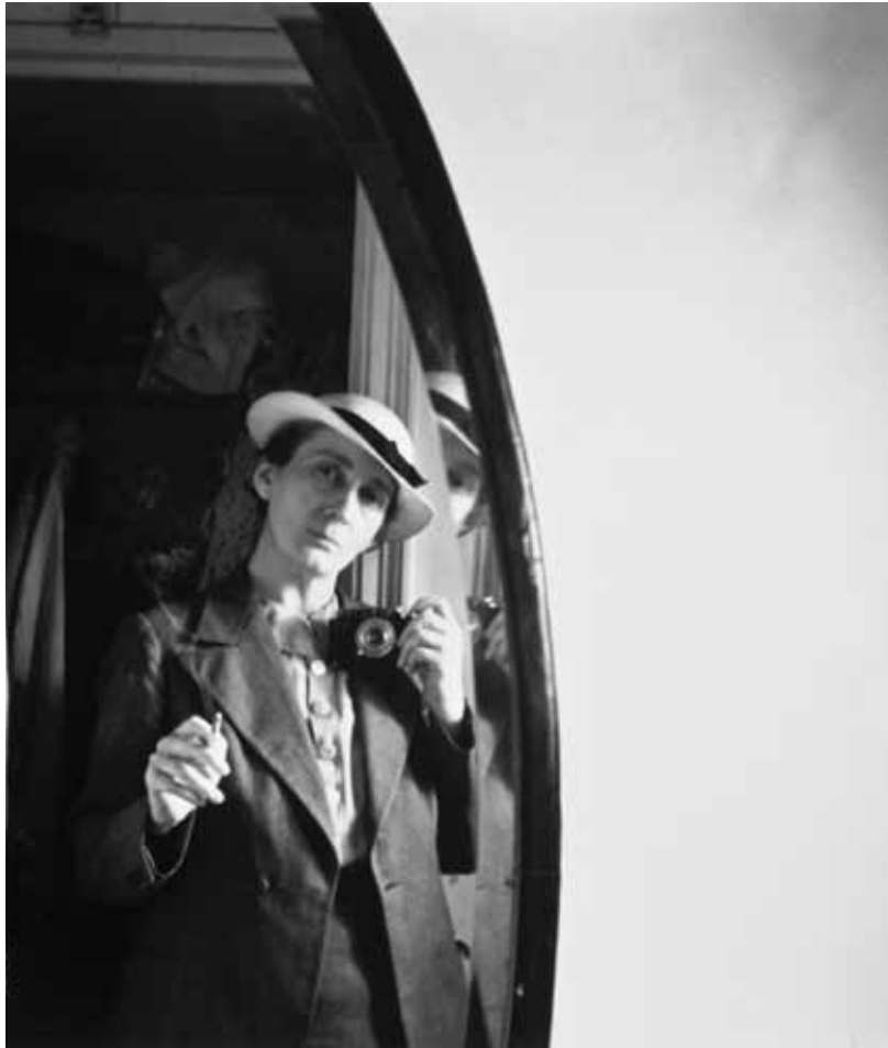
Selbstporträt, New York 1937