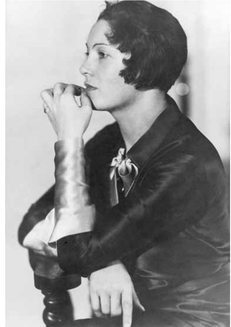
Carola Neher, Berlin 1932