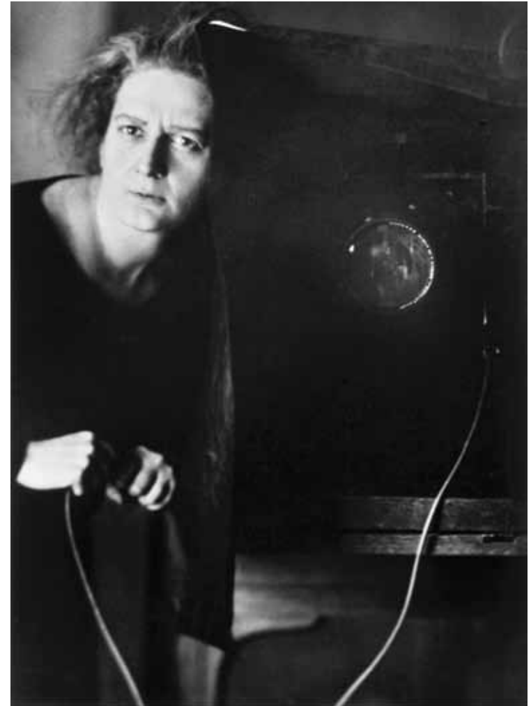
Selbstporträt, Berlin 1929