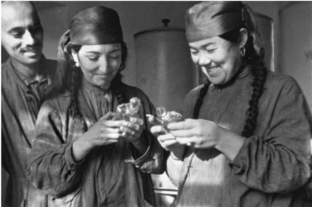
In der Fabrik für Ätheröle und Chemie, in der auch Parfüm hergestellt wird, Chodschent, Tadschikische SSR 1932