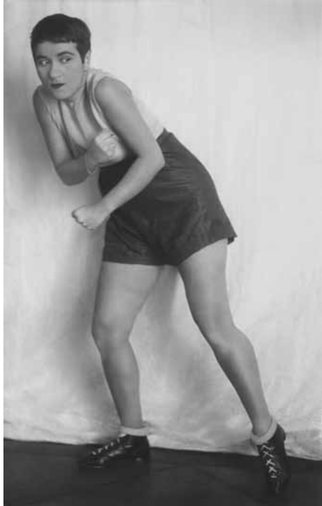
Valeska Gert, Sport , Berlin um 1928