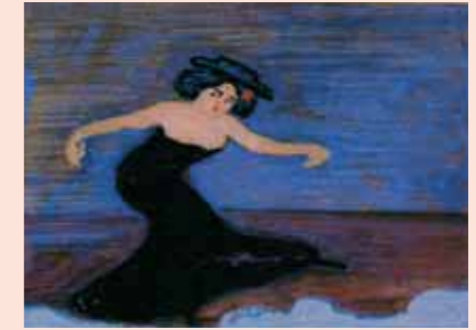
Abb. 3: Marianne Werefkin, Sängerin, um 1907/08, Standort unbekannt

Jeanne Mammen erfasste solche von unfreiwilliger Komik geprägten Situationen vergleichbar intuitiv und scharf beobachtend. Eine Gabe, die ihr in den Illustrationen, Karikaturen und Gesellschaftsszenen für Witzblätter und satirische Zeitschriften im Berlin der 1920er-Jahre den Lebensunterhalt sicherte. Mit ironisch-karikierendem Unterton war sie insbesondere den Schwächen und Stärken der »Neuen Frau« auf der Spur, die mit gekürztem Haar und Rock, sportlich, mode- und offensichtlich selbstbewusst den urbanen Raum eroberte (Abb. 4, Kat. S. 61). Protagonistinnen, wie sie zu Beginn der 1930er-Jahre Irmgard Keun in ihren erfolgreichen Gesellschaftssatiren beschreiben sollte. »Eine schreibende Frau mit Humor, sieh mal an!«, hatte dazu Kurt Tucholsky hörbar überrascht notiert. 41 Jeanne Mammen zollte der Satiriker angesichts des »undisziplinierten Geschmiers der meisten [i] Ihrer Zunftkollegen« nicht weniger Respekt: »In dem Delikatessenladen, den uns Ihre Brotherren wöchentlich oder monatlich aufsperrten, sind Sie so ziemlich die einzige Delikatesse.« 42 Abseits der beißenden Satire eines George Grosz oder Otto Dix