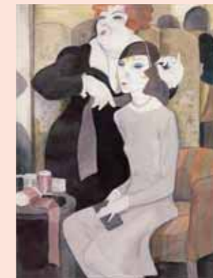
Abb. 4: Jeanne Mammen, Der neue Hut, 1929, Staatsgalerie Stuttgart