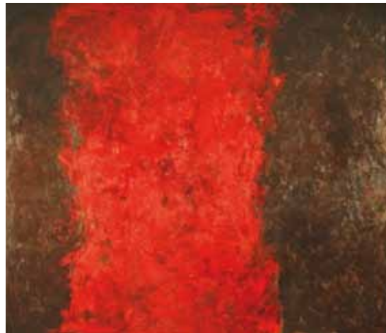
| Theodoros Stamos 1958 |