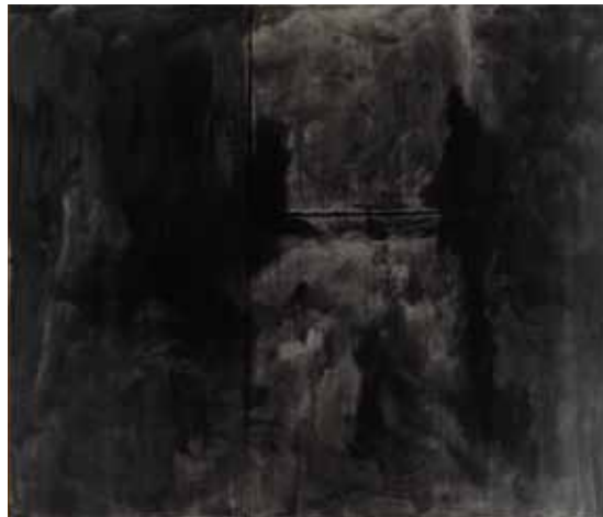
| Robert Motherwell 1958 |