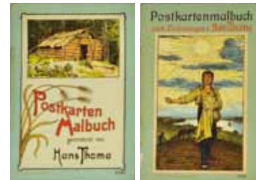
Abb. 1 Hans Thoma: Postkartenmalbücher, Städel Museum, Frankfurt am Main

Anonym: Hans Thoma , 1905, Städel Museum, Frankfurt am Main