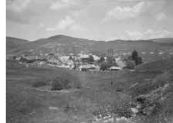
Abb. 1 Anonym: Blick auf Bernau, ca. 1885, Städel Museum, Frankfurt am Main