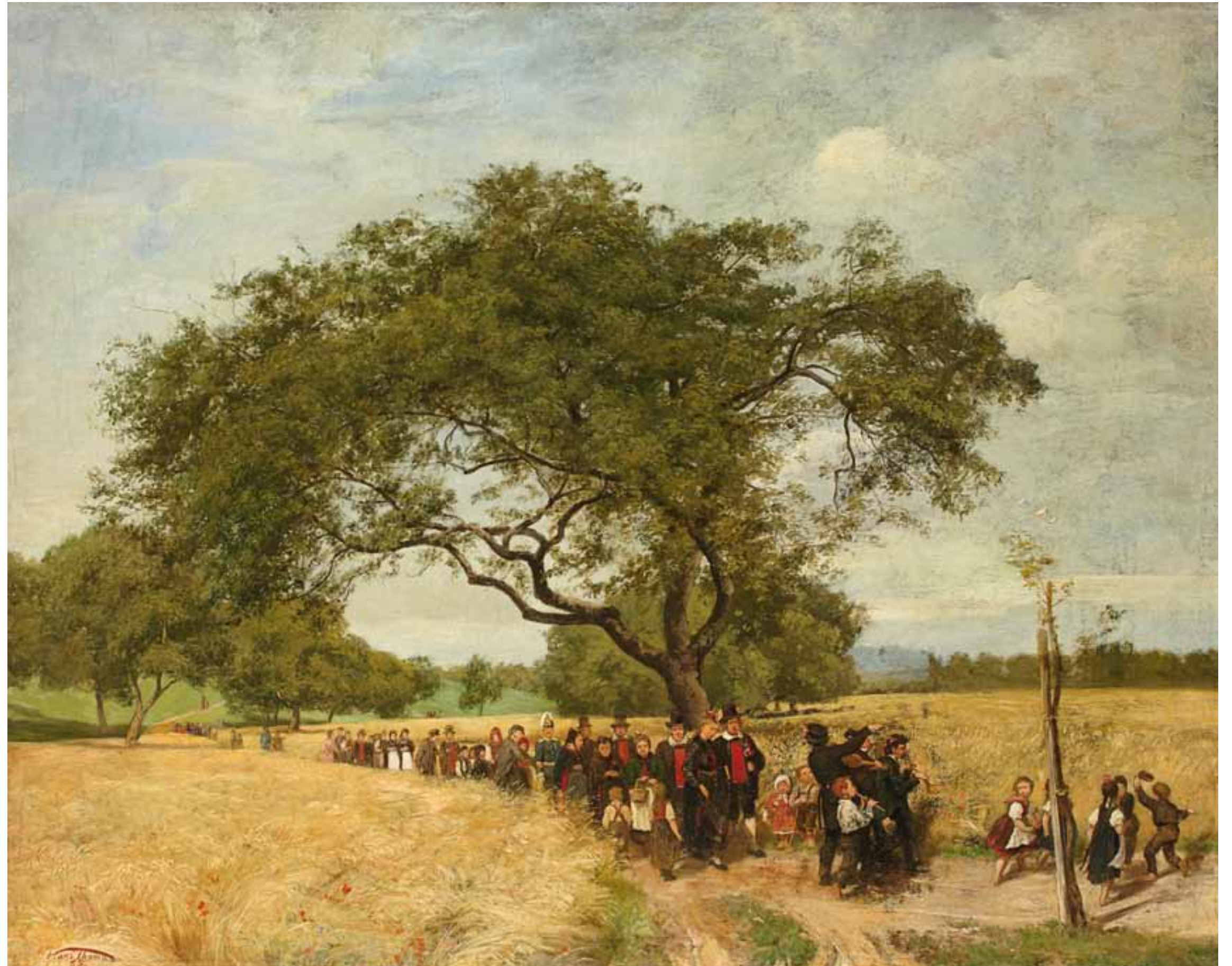
4 Sommerlandschaft mit einem Hochzeitszug, 1869 Öl auf Leinwand, 86 x 113 cm, Inv.-Nr. SG 31 Erworben 1908