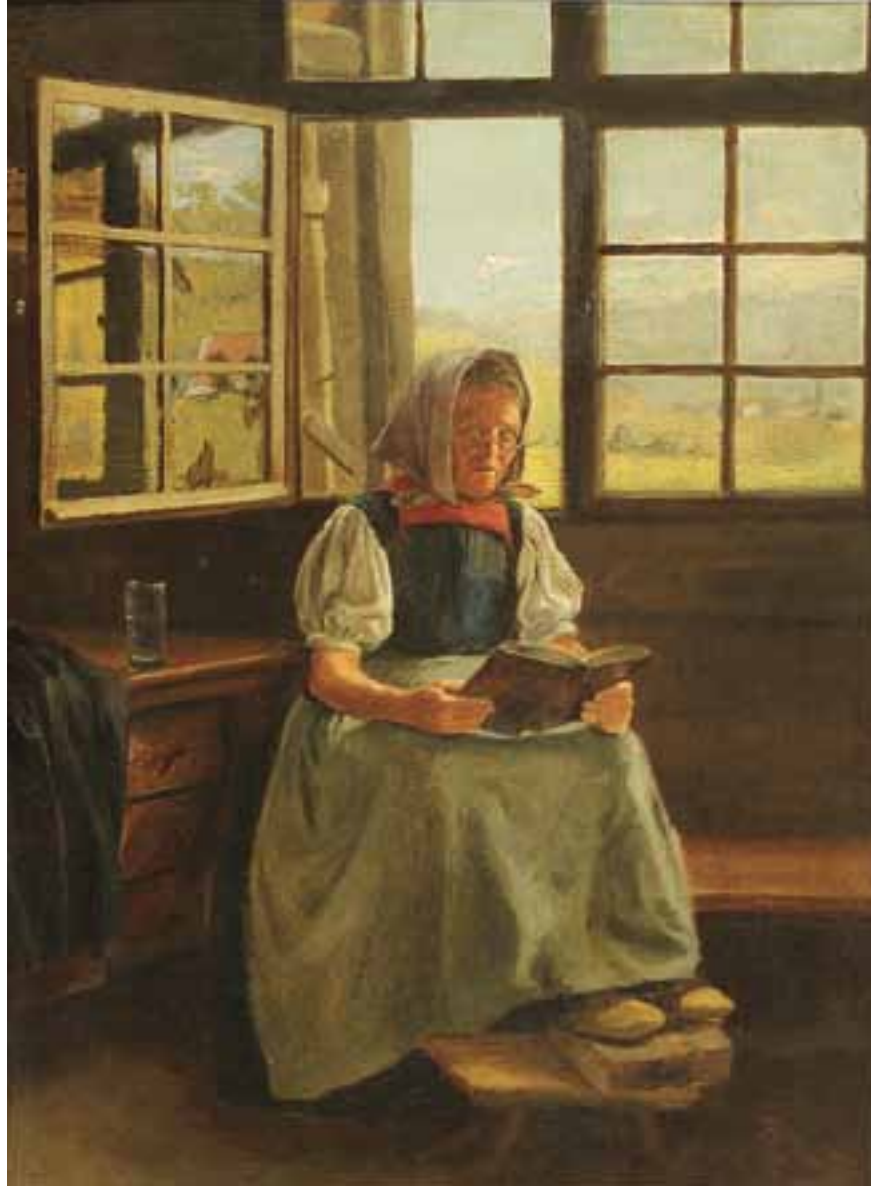
1 Hans Thoma Mutter im Schwarzwaldstübchen, 1861 Öl auf Pappe, 46,5 × 34,5 cm, Inv.-Nr. SG 898 Erworben 1939 mit der Hans Thoma-Sammlung Eiser-Küchler