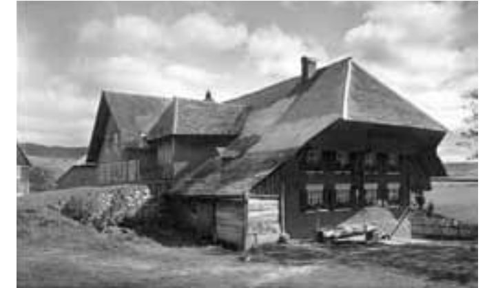
Abb. 2 Hans Thomas Geburtshaus in Bernau, ca. 1930, Postkarte, Städel Museum, Frankfurt am Main