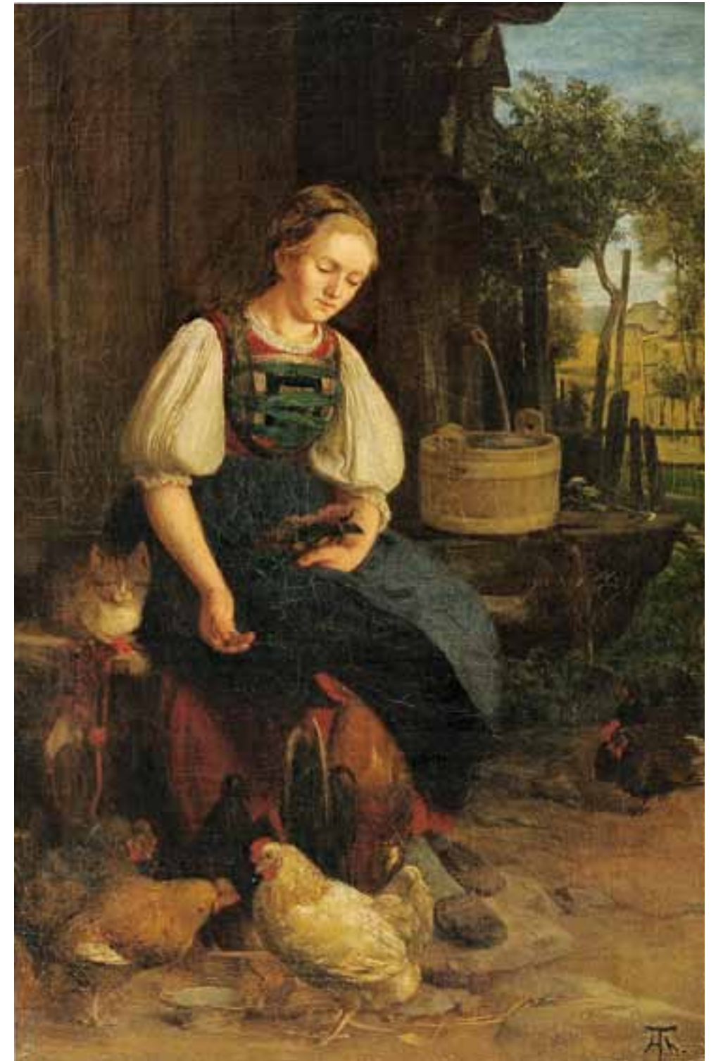
2 Hühnerfütterung, 1864 Öl auf Leinwand, 94 × 61,7 cm, Inv.-Nr. SG 899 Erworben 1939 mit der Hans Thoma-Sammlung Eiser-Küchler