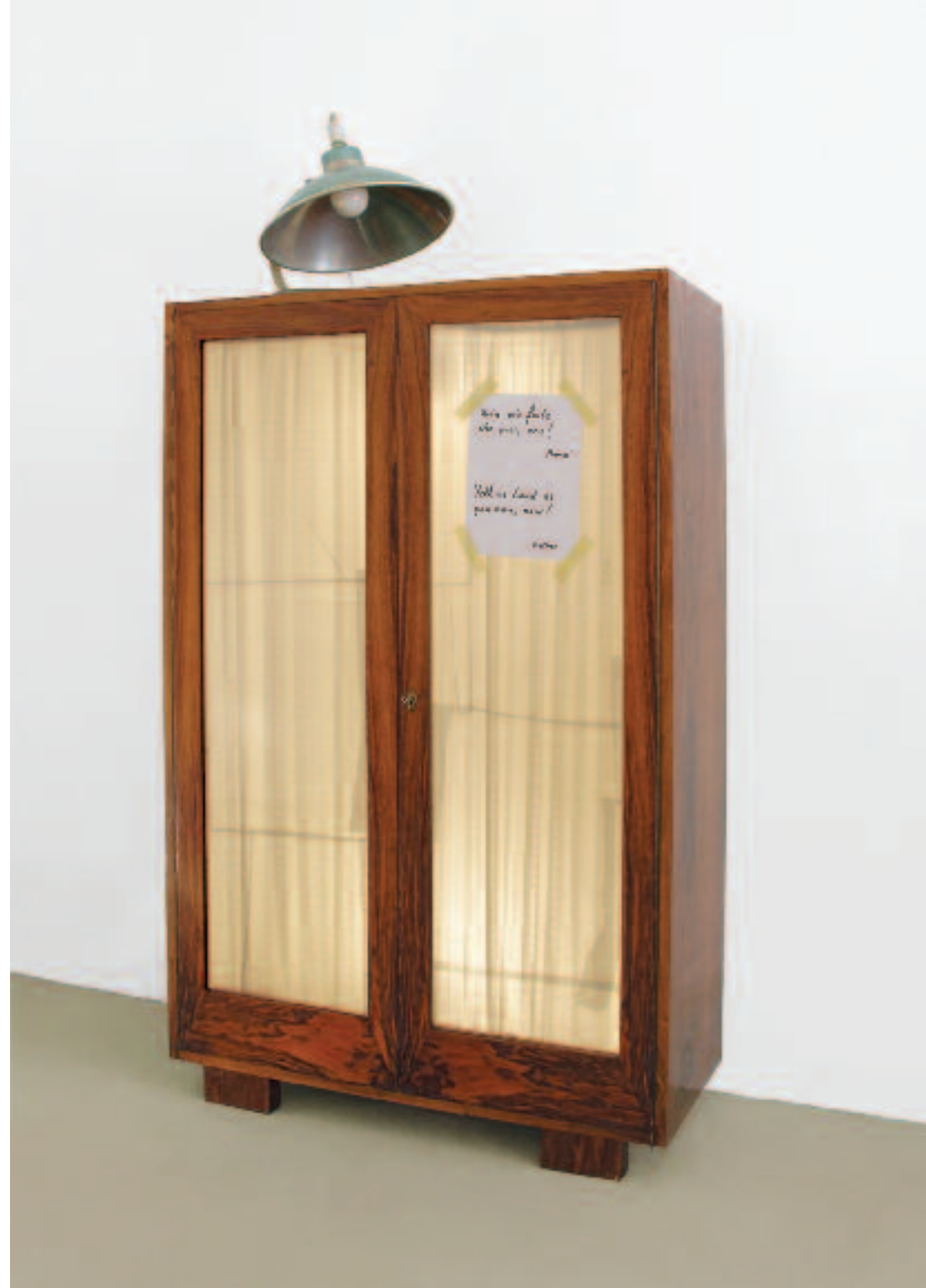
Mutters Rat/Mother's Advice , 2010, verschiedene Materialien/mixed media