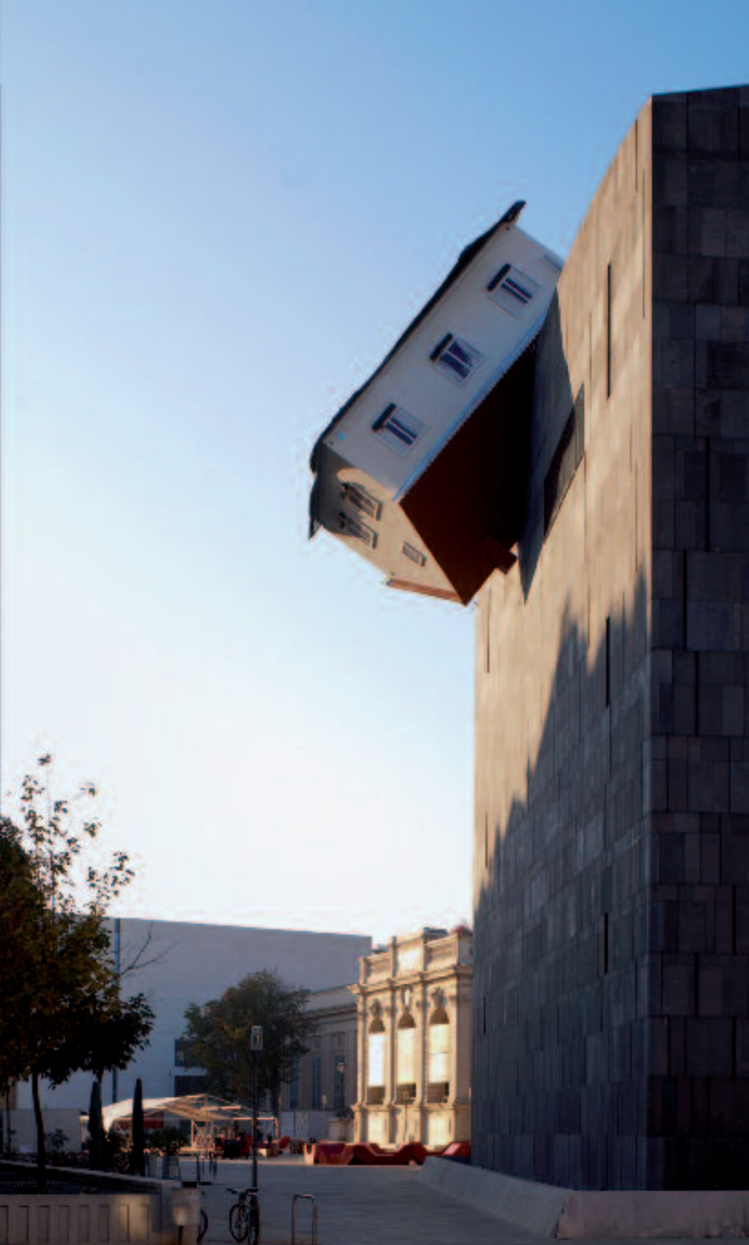
House Attack, 2006, verschiedene Materialien/mixed media