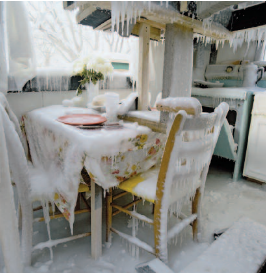
Deep North (Kitchen), 2008, C-Print/Video