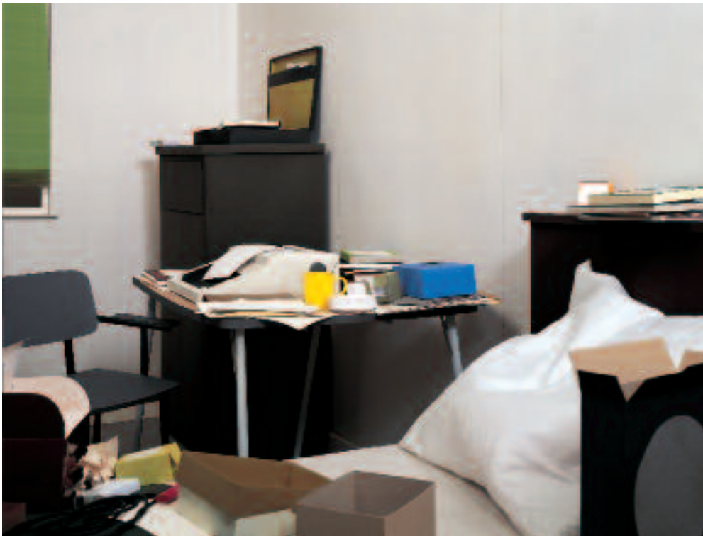
Zimmer/Room, 1996, C-Print/Diasec

Heimsuchung ist eines dieser in seiner Bedeutung schillernden Worte, das einen darüber grübeln lässt, ob Sprache möglicherweise nur dann in einem radikalen Sinn wahr und Erkenntnis fördernd ist, wenn sie sich einer klaren Lesbarkeit, einem eindeutigen Sinn entzieht und stattdessen Mehrdeutigkeiten, Paradoxa und Aporien produziert. Diese Behauptung scheint nur solange gewagt, wie wir davon ausgehen wollen, dass die Welt, die uns umgibt, die Realität, in der wir leben, nach objektiv gegebenen Kriterien geordnet ist und als transparentes Ganzes jederzeit offen und eindeutig vor uns liegt. Genau daran aber bestehen begründete Zweifel; und dies nicht erst seit dem aufklärerisch verfüzten „Ausgang des Menschen aus seiner selbst verschuldeten Unmündigkeit“, der die Verantwortung für die Welt und ihre vernünftige Ordnung von der göttlichen Ebene auf die der Subjekte verlagerte. Zumal diese damit nicht nur in einem bislang ungekannten Maß ermächtigt, sondern im Grunde ebenso grundsätzlich überfordert wurden. Die subjektive Erschließung der Welt ist seitdem stets sowohl ein Motor für den ständigen Drang nach Wissen und Erkenntnis als