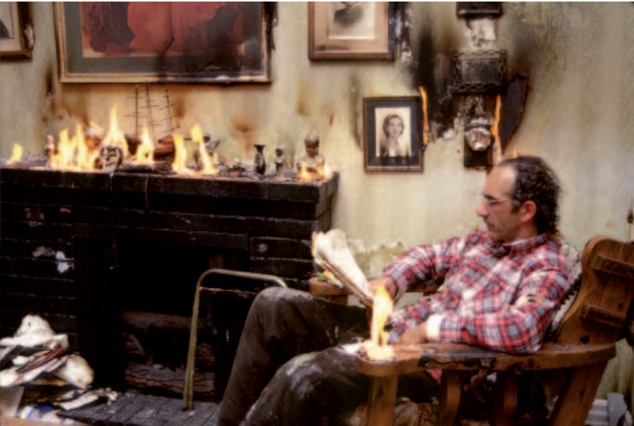
Burn , 2002, Video