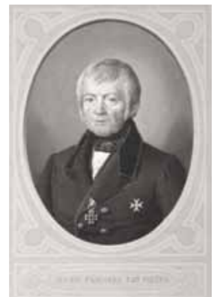
Abb. 4 Hermann Sagert, Brustbild des Oberpräsidenten Ludwig Freiherr von Vincke, nach 1840