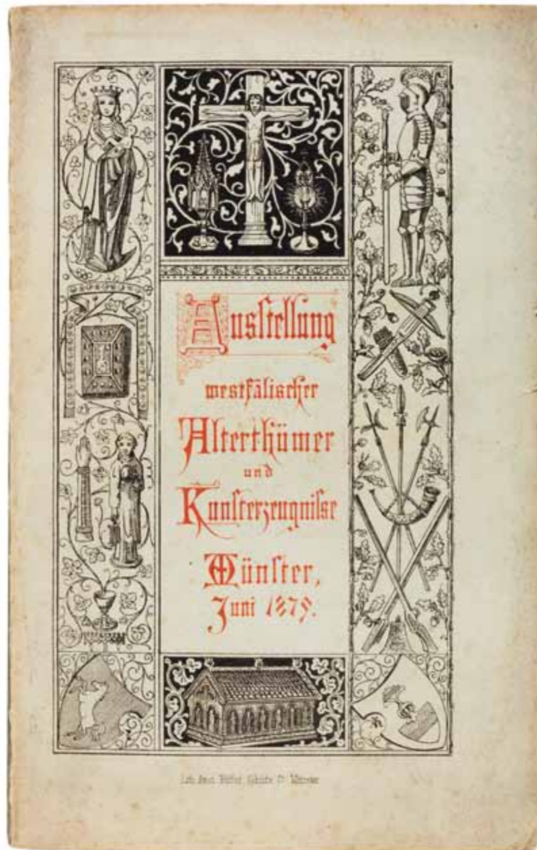
Abb. 1 Titelschlag des Kataloges zur Ausstellung Westfälischer Alterthümer und Kunsterzeugnisse , Juni 1879 Detail-Informationen zu den Abbildungen 1 bis 44 siehe die Seiten 302/303