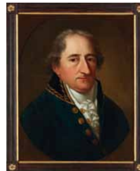
Abb. 2 Johann Christoph Rincklake, Brustbild des Staatsministers Karl Freiherr von und zum Stein, 1804

Nach dem politischen Einschnitt durch die 1848er Revolution rückten die Förderung und der Ankauf westfälischer und kritisch-satirischer Gegenwartskunst verstärkt ins Blick-