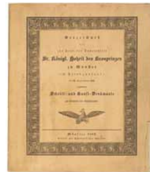
Abb. 3 Titelschlag des ältesten im Bestand der Museumsbibliothek nachweisbaren Ausstellungskataloges von 1836