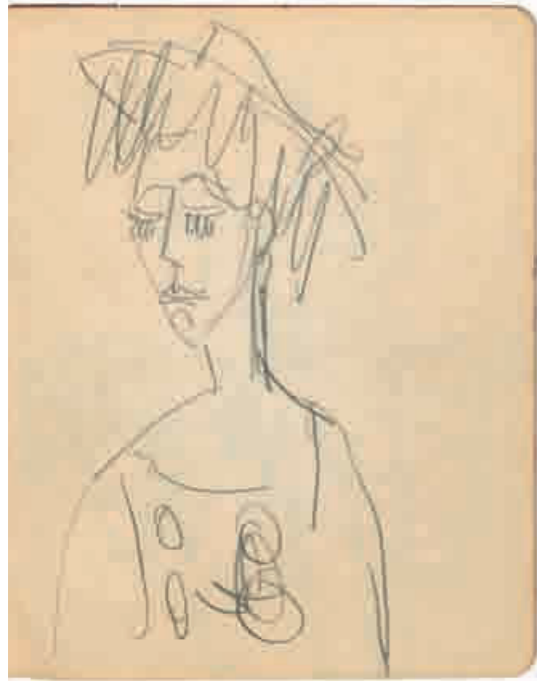
S. 41 recto: 1. Akt, 4. Szene: Porträt Gritli