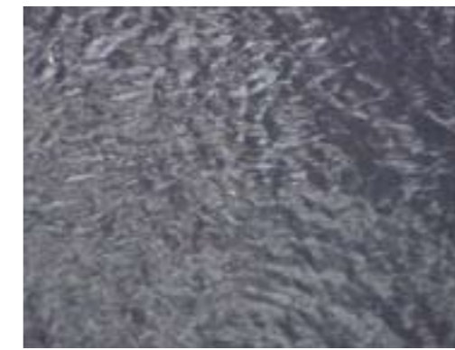
Abb. 1, 2: Christoph Brech, Video-Stills aus The Barrow , Irland 2008

„Wie schwer fällt mir zu sehen, was vor meinen Augen liegt!“ LUDWIG WITTGENSTEIN 1